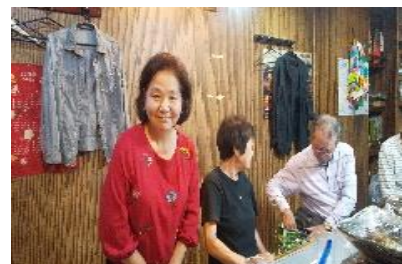
べっぴんのママさん