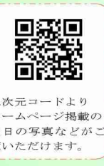
二次元コードよりホームページ掲載の当日の写真などがご覧いただけます。

② 醒泉シルバークラブ提案「おもいやりスペース」。高齢者の方やお身体の不自由な方などが、休憩する場所が無い事を考慮して、今年から「おもいやりスペース」を作りまし